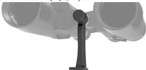
Slika 7: Pritrditev adapterja za stojalo

Nekateri daljnogledi imajo vgrajen adapter za stojalo. Na teh modelih je pod pokrovom luknja za navojni vijak. Za pritrditev adapterja najprej odstranite pokrov, nastavite adapter in ga privijte (Slika 7). Takšni montažni daljnogledi omogočajo dodatno stabilnost in udobje predvsem ob večjih povečavah.