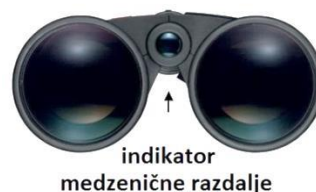
Slika 4: Zenična razdalja

Razdalja med zenicama se od človeka do človeka razlikuje. Da bi dosegli optimalno nastavitev, daljnogled držite v položaju za opazovanje in obe polovici daljnogleda premikajte navzven ali navznoter (Slika 4), dokler pri pogledu skozi oba okularja ne zagledate samo eno okroglo sliko. Tako je daljnogled pravilno nastavljen za zenično razdaljo vaših oči.