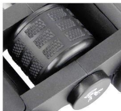
Slika 5: Gumb za ostrenje osrednji gumb za ostrenje