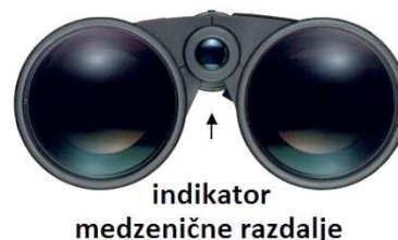
Slika 4: Zenična razdalja

Razdalja med zenicama se od človeka do človeka razlikuje. Da bi dosegli optimalno nastavitev, daljnogled držite v položaju za opazovanje in obe polovici daljnogleda premikajte navzven ali navznoter (Slika 4), dokler pri pogledu skozi oba okularja ne zagledate samo eno okroglo sliko. Tako je daljnogled pravilno nastavljen za zenično razdaljo vaših oči.