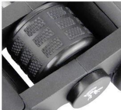
Slika 5: Gumb za ostrenje osrednji gumb za ostrenje