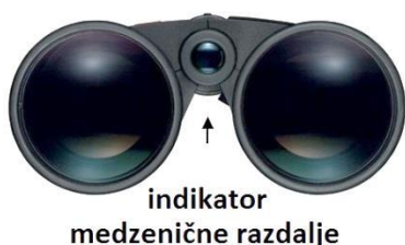
Slika 4: Zenična razdalja

je daljnogled pravilno nastavljen za zenično razdaljo vaših oči.