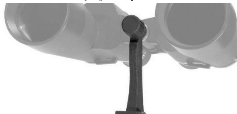
Slika 7: Pritrditev adapterja za stojalo

Nekateri daljnogledi imajo vgrajen adapter za stojalo. Na teh modelih je pod pokrovom luknja za navojni vijak. Za pritrditev adapterja najprej odstranite pokrov, nastavite adapter in ga privijte (Slika 7). Takšni montažni daljnogledi omogočajo dodatno stabilnost in udobje predvsem ob večjih povečavah.