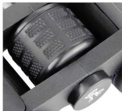
Slika 5: Gumb za ostrenje osrednji gumb za ostrenje