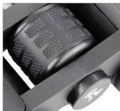
Slika 5: Gumb za ostrenje osrednji gumb za ostrenje